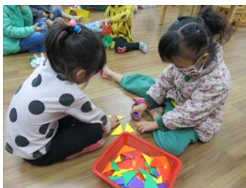
益智區-排出魚的形狀