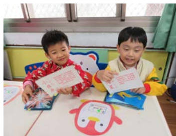
語文區-欣賞海洋圖卡