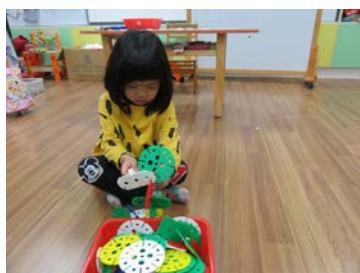
益智區-動動金頭腦