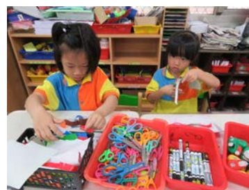
美勞區-繪製海洋生物