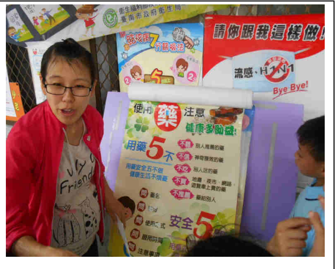
與生祥藥局合作推廣正確用藥觀念