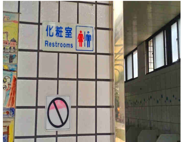
舒適乾淨如廁環境