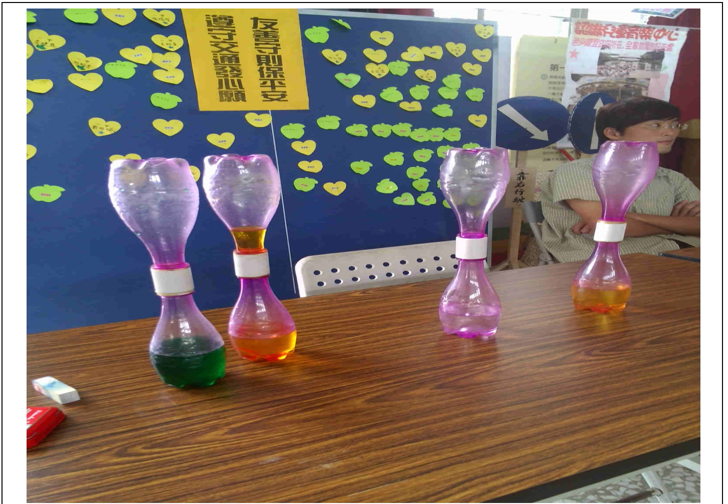
利用寶特瓶製作自然教具