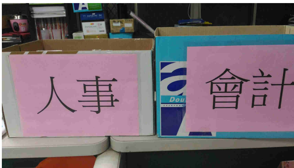
回收紙箱當公文轉運站