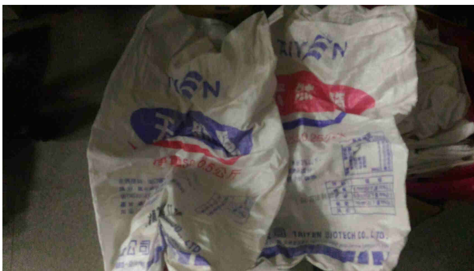
鹽袋、米袋回收再利用