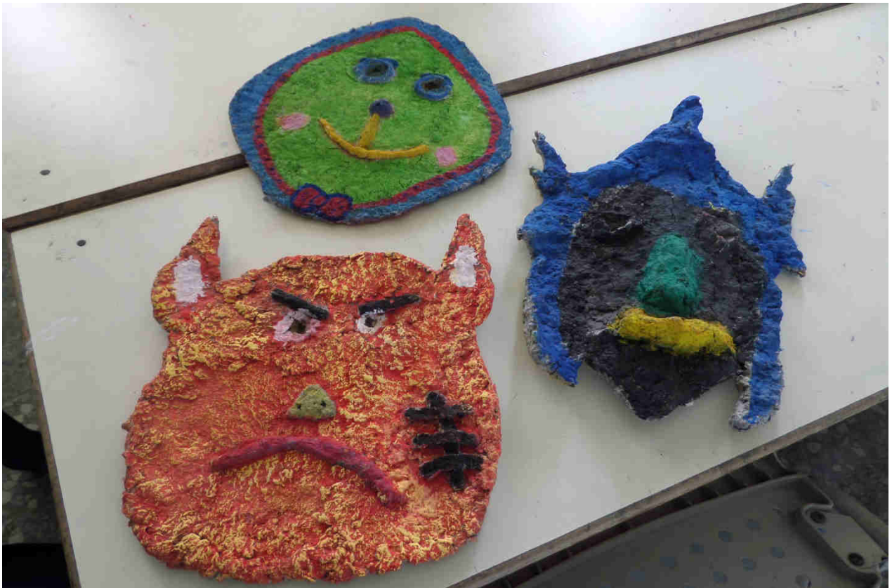
利用紙漿製作面具