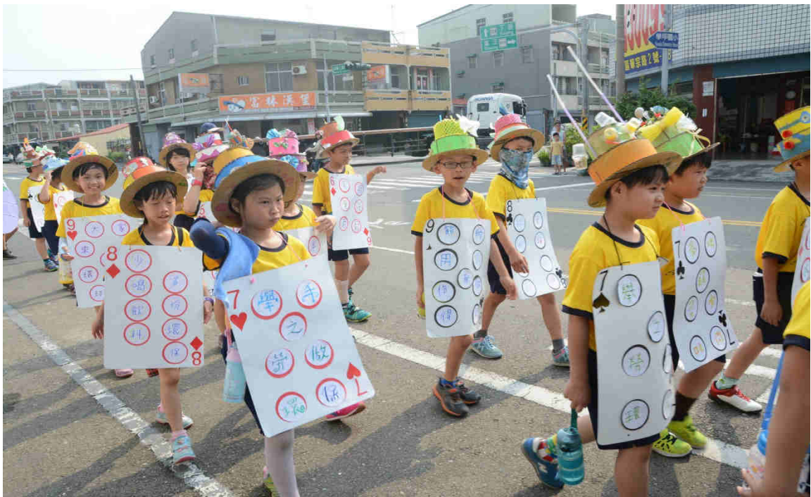
110 校慶踩街活動利用廢棄物妝點角色