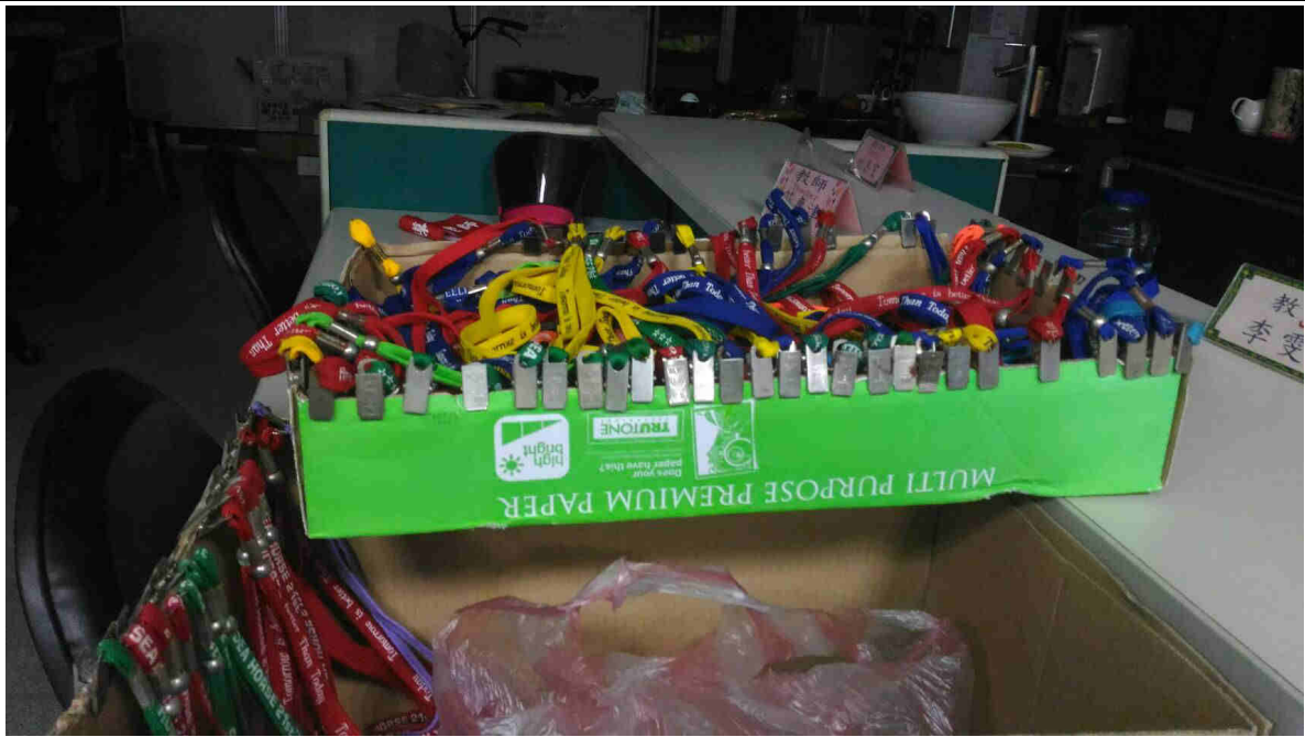
紙箱蓋回收整理名牌套繩