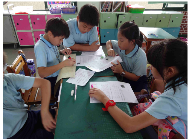
學生分組討論緊急避難背包內容物。