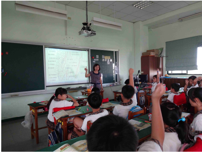
教師講述臺灣位於地震帶上。