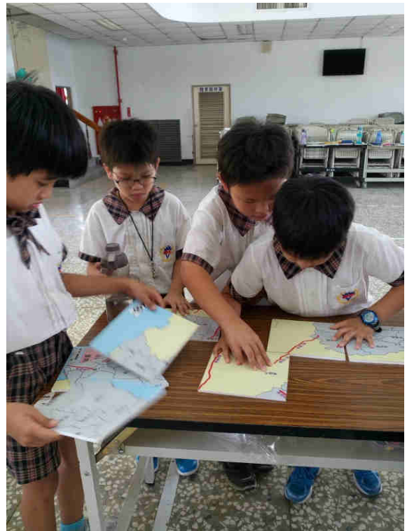
認識地震帶--學生拼出台南市地震帶。