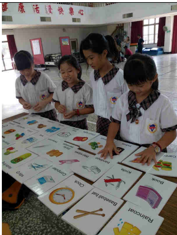
找一找--緊急避難背包要放什麼呢？