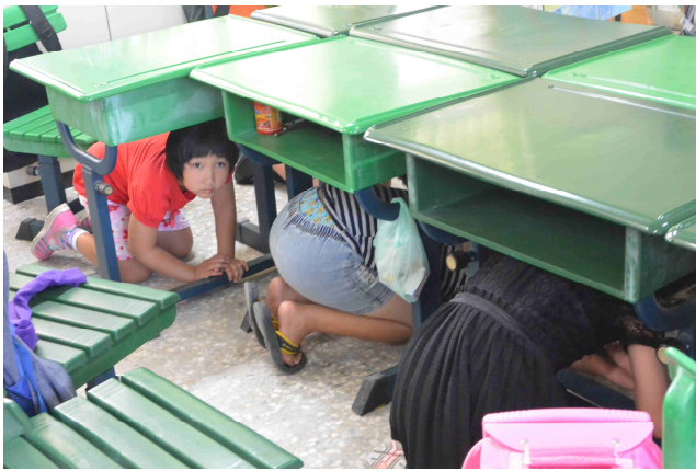
地震來臨時的躲避方式