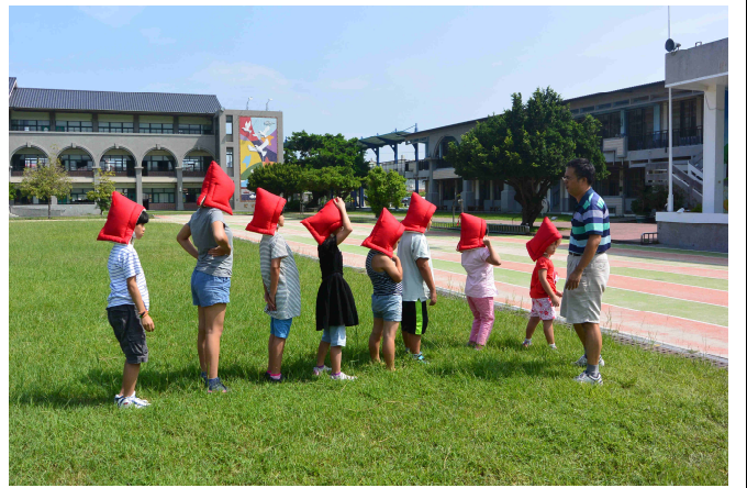
正確的戶外避難方式