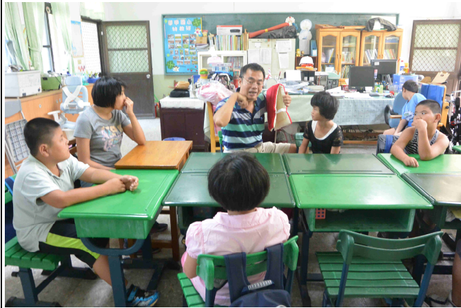
教導學生安全頭套的使用方法