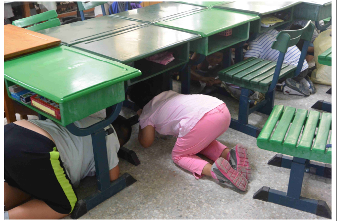
地震來臨時的躲避方式