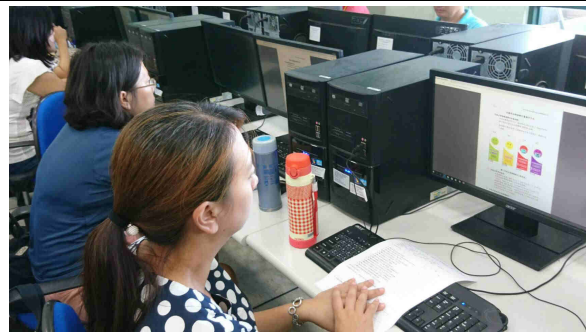
說明：學員上網操作(也說明空品旗意義)