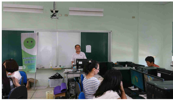
說明：講師上課時況