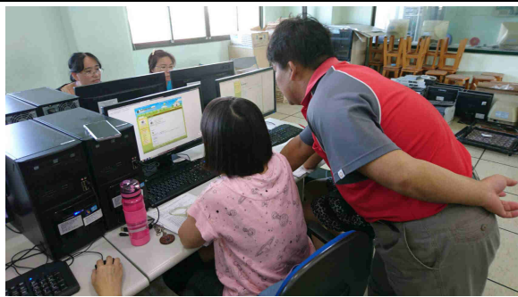
說明：學員上網操作