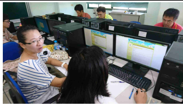
說明：學員上網操作