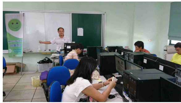
說明：講師上課也同時說明空氣品質旗幟